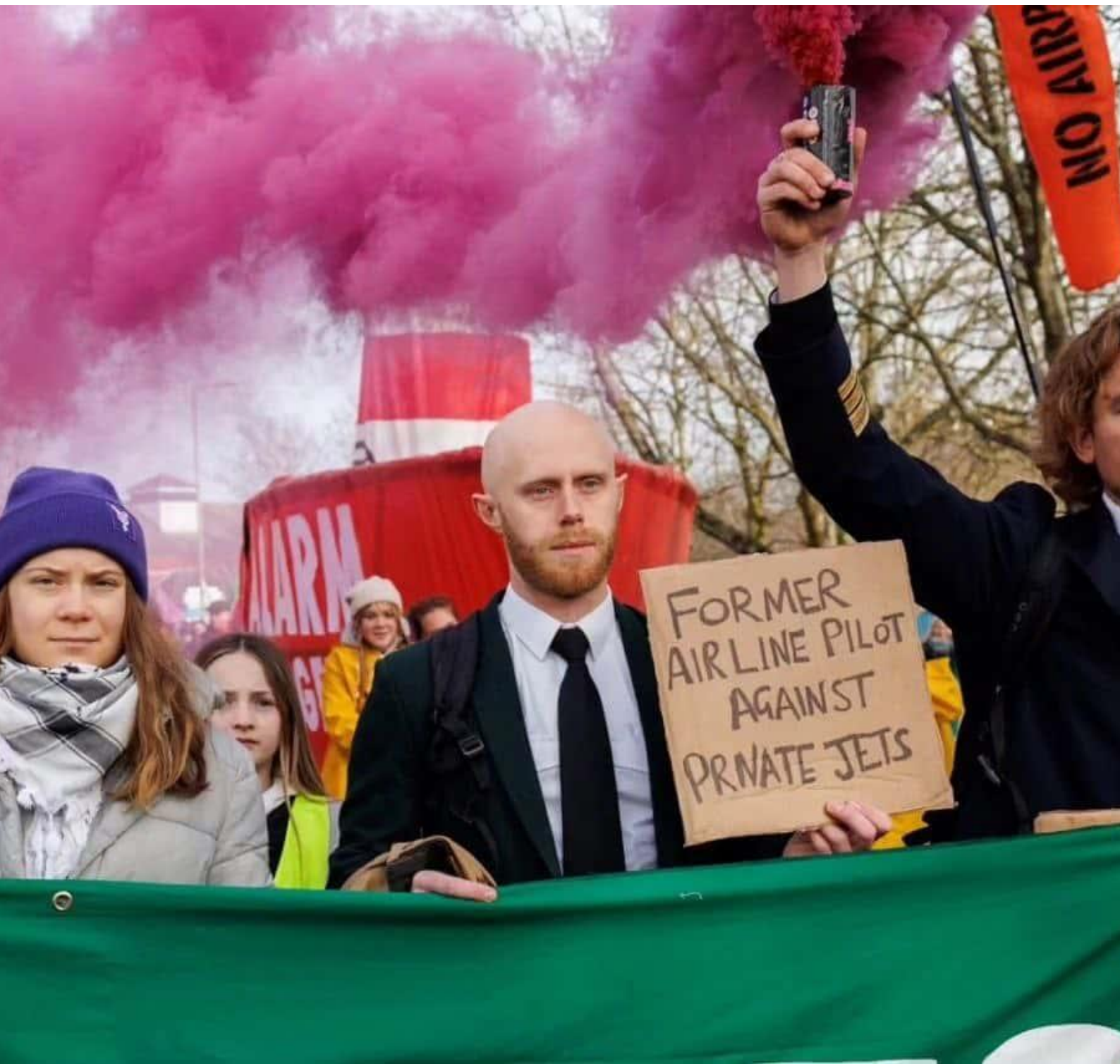
Farnborough, Reino Unido: Rebeldes, residentes locales y la reina del clima Greta Thunberg protestan contra la ampliación del aeropuerto que haría que los vuelos en jets privados crecieran de 50.000 a 70.000 al año . Los jets privados son hasta 30 veces más contaminantes que los vuelos comerciales y contribuyen a una élite insondablemente egoísta. Una semana después, Greta salió libre de un tribunal de Londres después de ser arrestada durante sus protestas en una conferencia sobre petróleo y gas en la ciudad el año pasado.