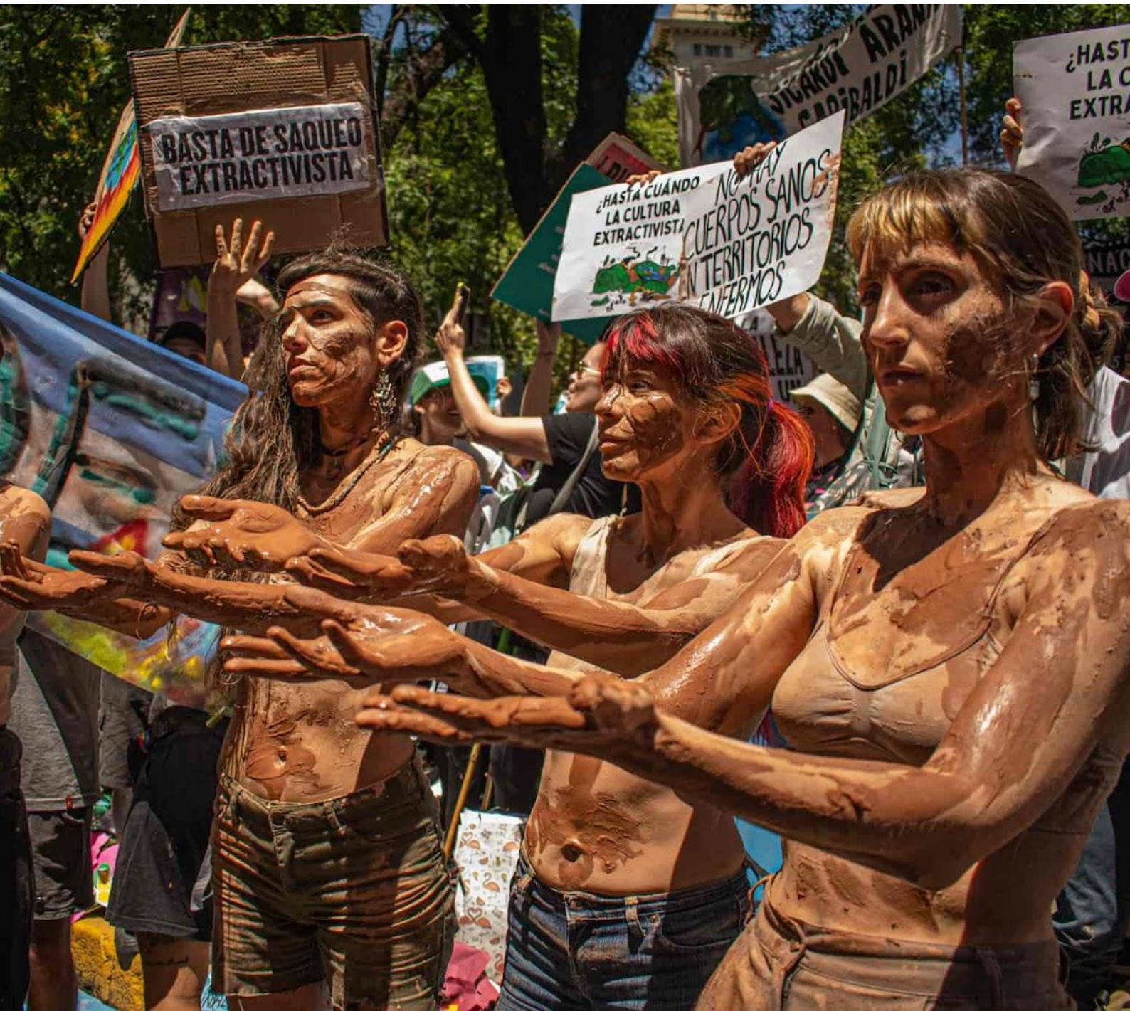
Buenos Aires, Argentina: XR Argentina se une a miles de activistas, sindicatos y ciudadanos en una huelga nacional contra las leyes impuestas por el nuevo presidente de Argentina. Si se aprueba, su 'ley ómnibus' hará que el país entre en una era oscura de protestas por un país regulado.