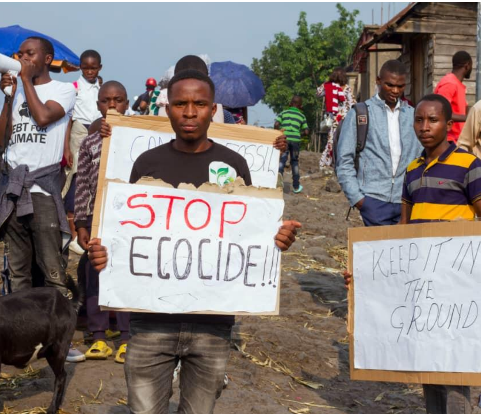
ivu del Norte, República Democrática del Congo: Miembros de XR Rutshuru marchan con las comunidades que viven junto al...erse a la propuesta de explotación de petróleo y gas allí. Quieren que el gobierno congoleño salvaguarde el parque, proteja a los m...nden de él y cancele cualquier licencia activa para la exploración petrolera allí.