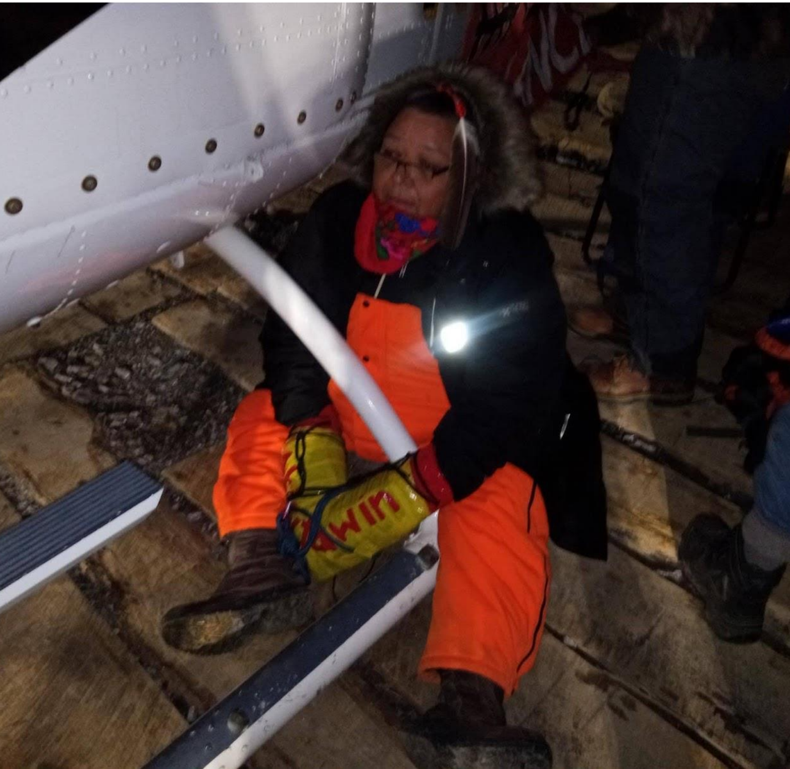
Virginia, EE.UU.: Una 'Mountain Mama' con Appalachianos contra los oleoductos se engancha en un helicóptero utilizado para el sitio remoto del oleoducto Mountain Valley, retrasando la construcción durante muchas horas. Ella y otro manifestante fueron arre