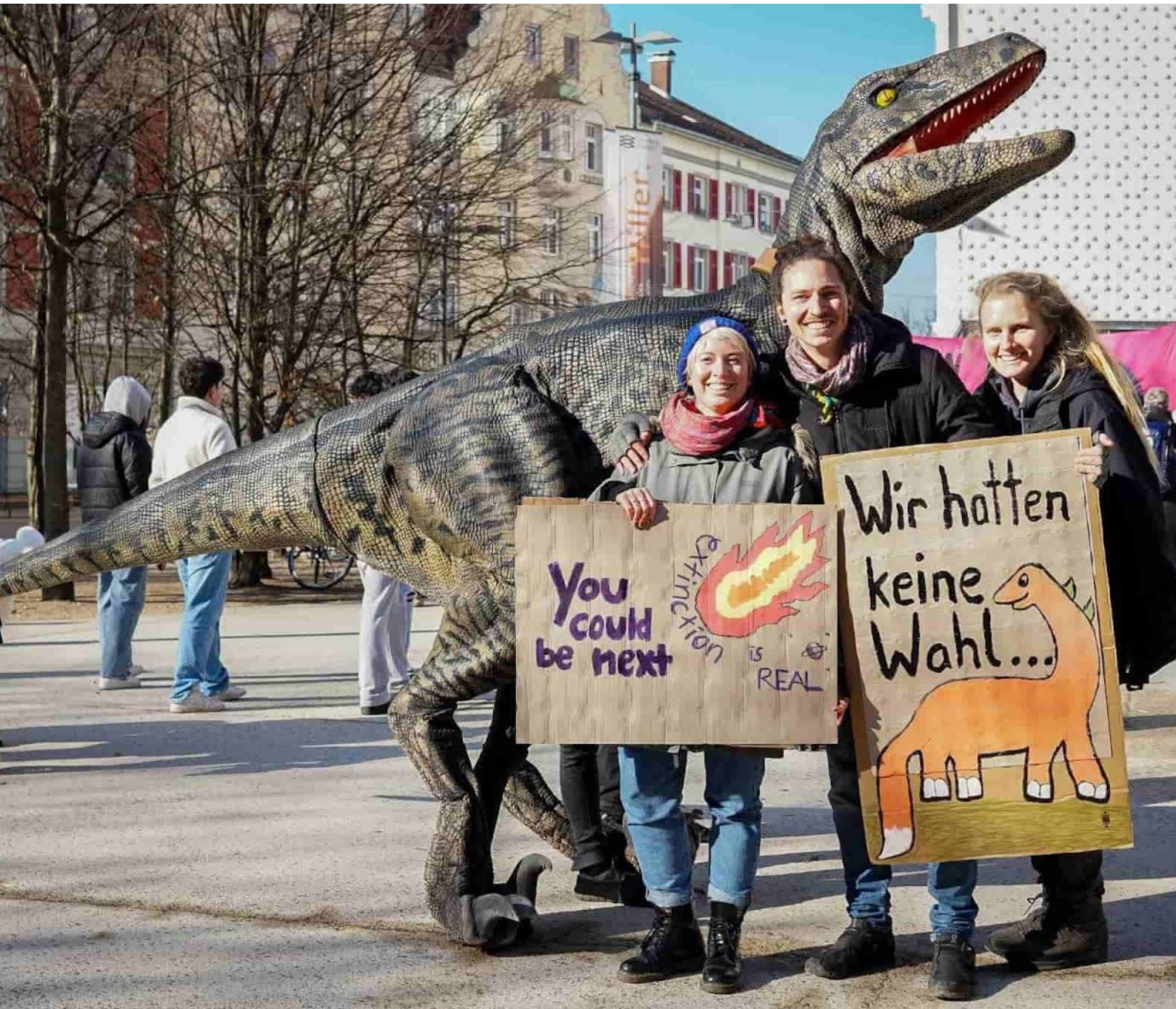
... dinosaurio fuera de Vorarlberg parlamento estatal. Cartel a la derecha: "No teníamos otra opción..."

en al megaproyecto ecocida Tunnel Spider . Además de evocar la imagen adecuada de una criatura oculta, amenazante y de múltiples "enfurece a quienes intentan promocionar el proyecto como algo bueno".