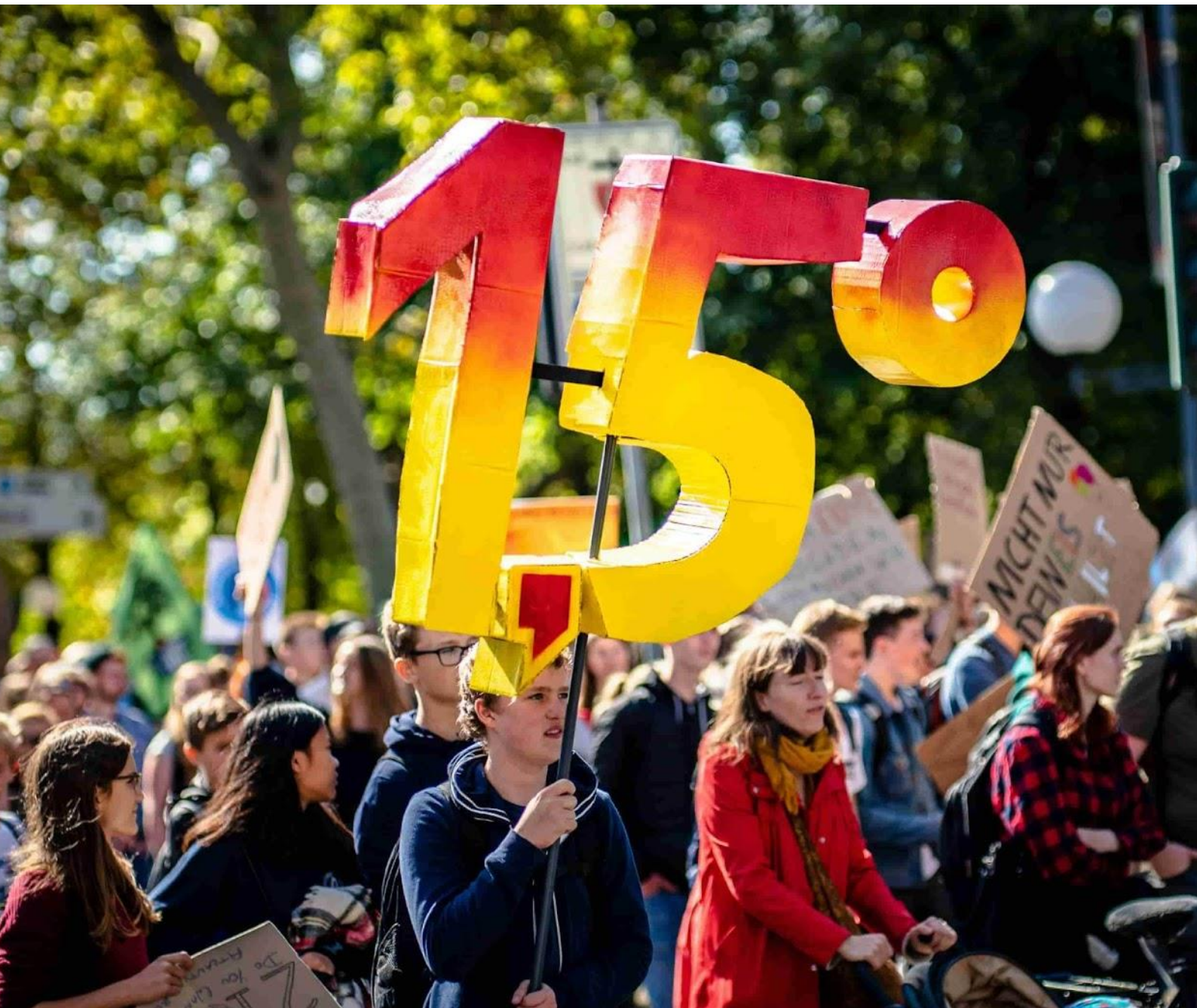
s For Future en Bonn, Alemania, 2019.

inglés , francés , alemán , hindi , italiano , polaco , portugués y español !)