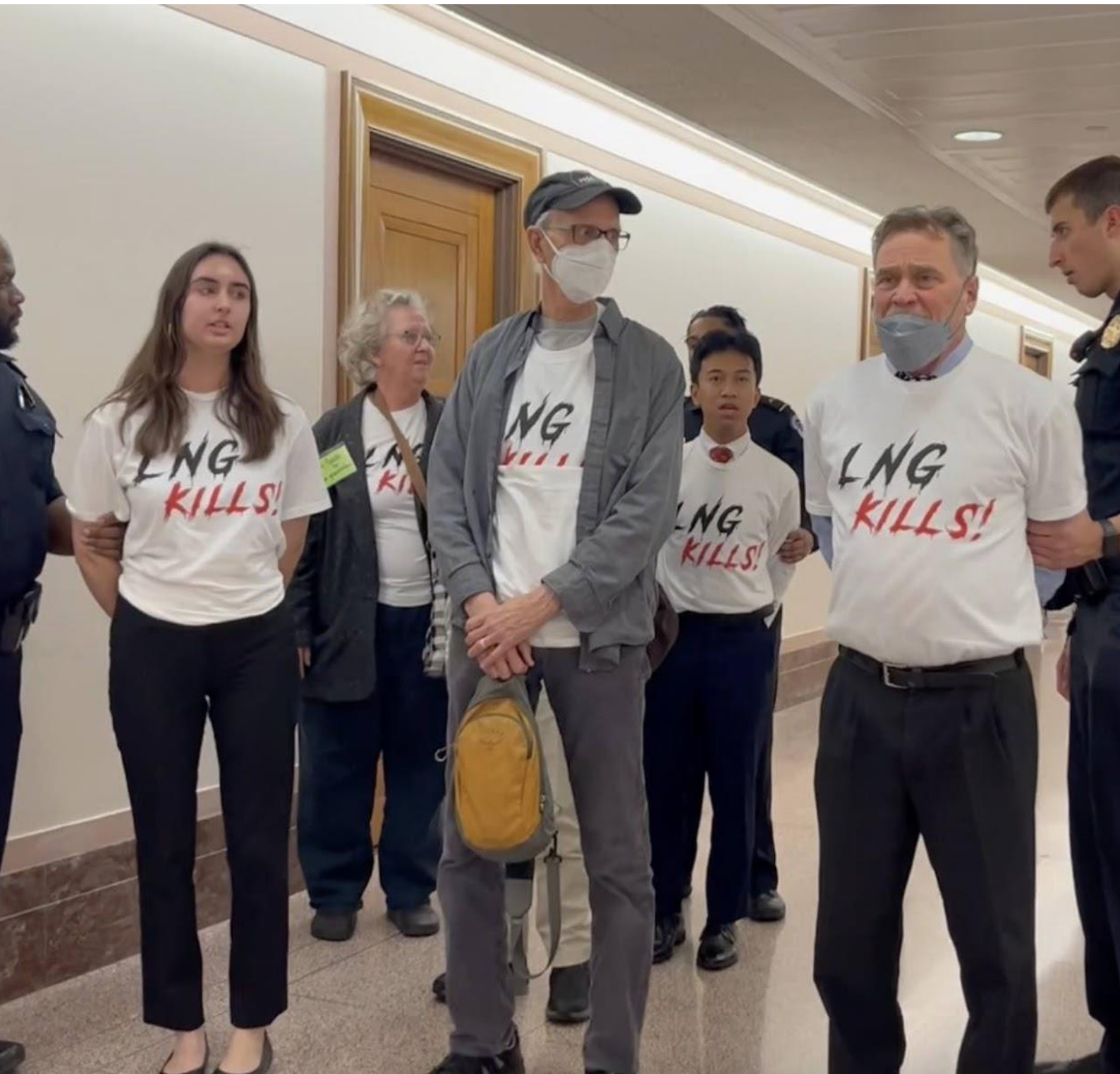
El 8 de febrero, activistas de Acción de Amigos de la Tierra interrumpieron a un senador financiado por las grandes petroleras

de XR DC, cuya campaña para Electrify DC está estrechamente vinculada con la presión para detener el GNL, dieron una nota de prensa como un "rayo de esperanza" en una lucha difícil con una industria que tiene sus garras profundamente arraigadas en el país. "La prohibición de GNL en funcionamiento y 10 más ya aprobadas, lo que coloca a Estados Unidos en el camino de duplicar el volumen de GNL en 2028".