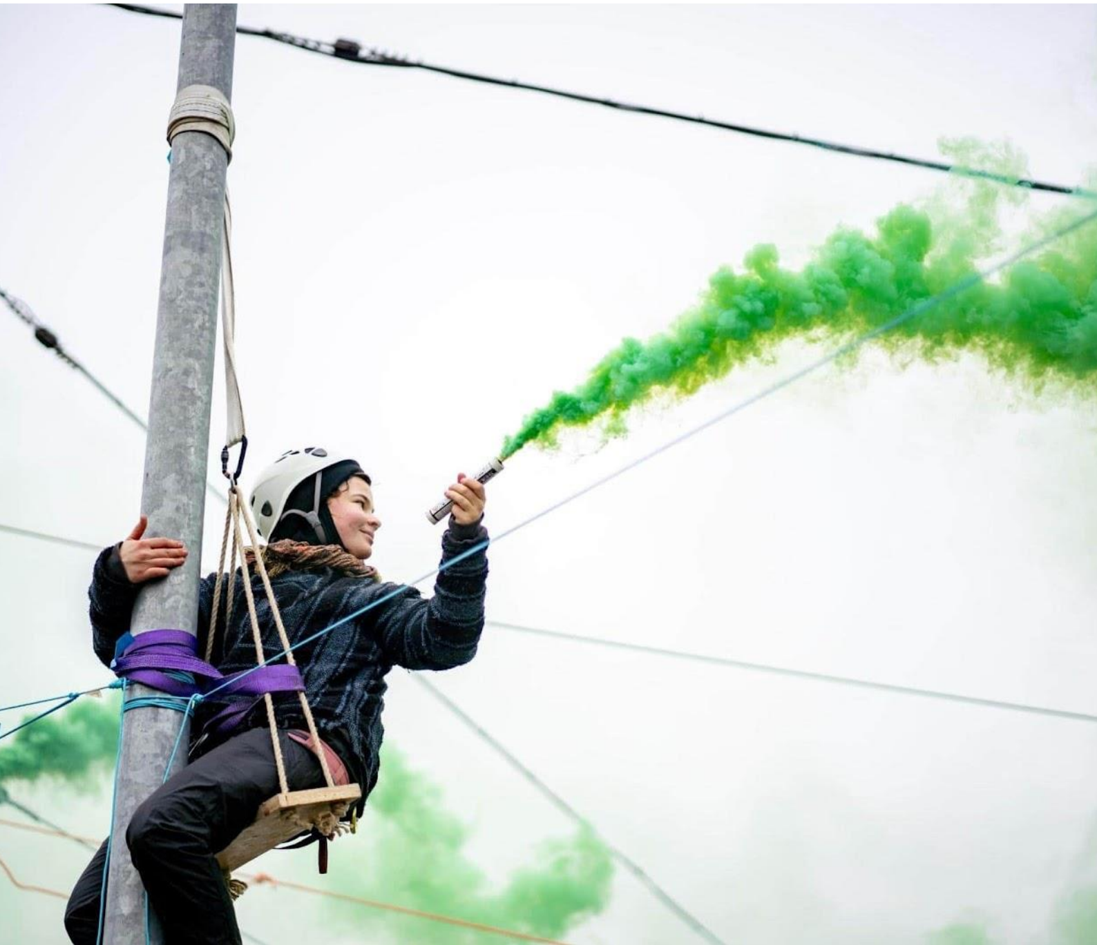
Una mujer escala una farola durante una acción contra el Tunnel Spider.

tenemos la rara visión de que algo positivo esté sucediendo en la política estadounidense: el presidente anuncia una pausa en las negociaciones hasta que se comprendan mejor los impactos climáticos. La noticia fue recibida con alegría y escepticismo por parte de los activistas. Esto se analiza en nuestro Informe Especial .