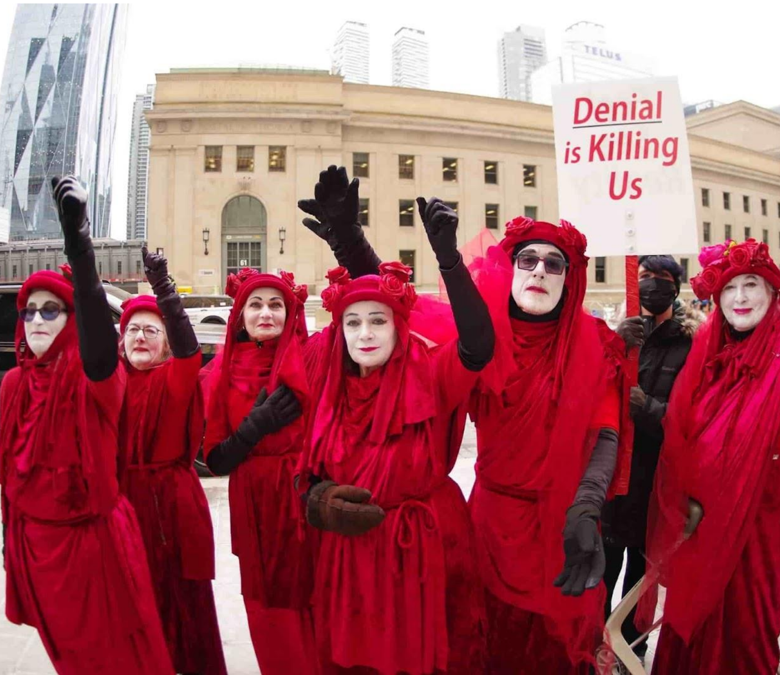
nto, Canadá: una nueva brigada Rebelde Roja visita la sede del Royal Bank of Canada, el mayor financiador de combustibles fósiles de París.